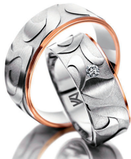
Van deze set van het exclusieve merk Meister werd van de herenring een heel speciale hanger gemaakt omdat hij geen ring wil dragen. Alleen al op de briljant van 0.05 karaat bespaarde het bruidspaar 165 euro...