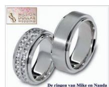
Deze ringen maakte Biesterveld Diamantairs voor het winnende paar van het TV programma Million Dollar Wedding.

De Biestervelds zitten al vijf generaties lang in het 'vak'. Het slijpen en verhandelen van diamanten is van vader op zoon doorgegeven. De huidige generatie Wim en Bram Biesterveld leiden het familiebedrijf met groot enthousiasme en passie voor het vak. Hun juweliersbedrijf is een begrip tot ver over de landsgrenzen. Vanwege de prachtige collecties die in de winkel en showroom te zien zijn. Ook het atelier waar klanten kunnen kijken hoe juwelen vervaardigd worden, is er debet aan. Een groot deel van de collectie wordt in eigen atelier vervaardigd en kan zodoende tegen veel scherpere prijzen dan elders worden aangeboden.