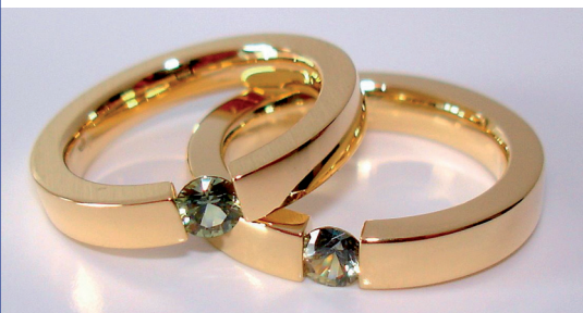
Een voorbeeld van ringen met EEDC gekleurde diamanten.